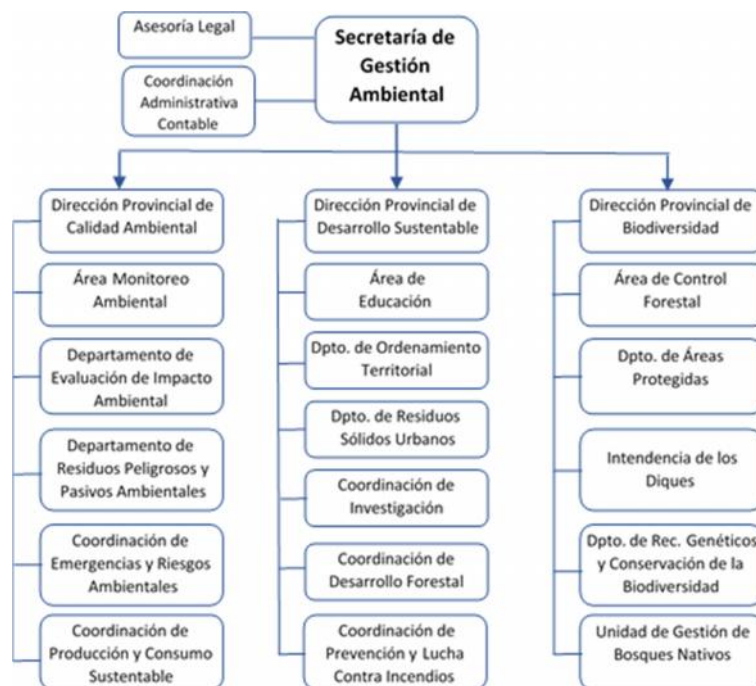
Figura 2: Organigrama de la Secretaría de Gestión Ambiental